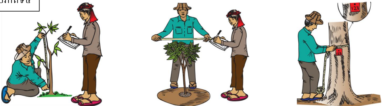
រូបភាពទី៥