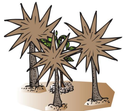
រូបភាពទី៣